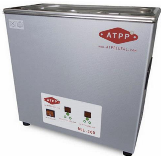
Vista General BUL-200